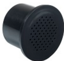
Filtre à charbon actif - FILTRE1 Il est recommandé de le changer tous les ans.

Application gratuite de gestion de cave à vin. Accédez à une représentation digitale de votre cave et au registre détaillé de son contenu.