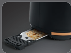
Slide-out crumb tray