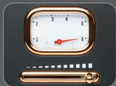
6 Browning temperature setting