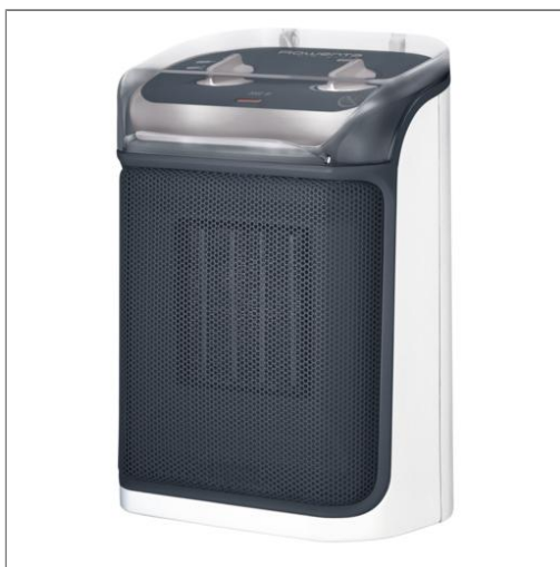
MINI EXCEL AQUA