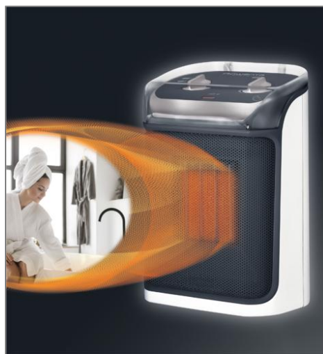
MINI EXCEL AQUA CHAUFFAGE SOUFLANT CERAMIQUE S09281F0