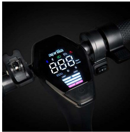
Couleur LED intégré