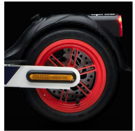
frein électronique avant et frein à disque arrière