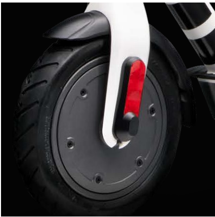
Pneus 8.5" avec chambre à air