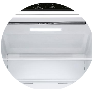
Door Cooling™ & Soft LED