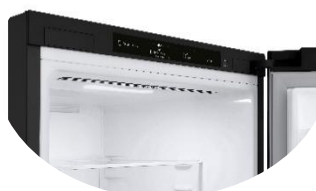
Display intérieur discret