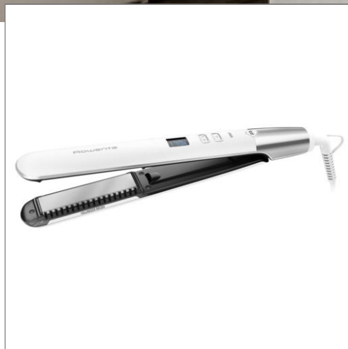
VOLUMIZER Lisseur SF4650F0