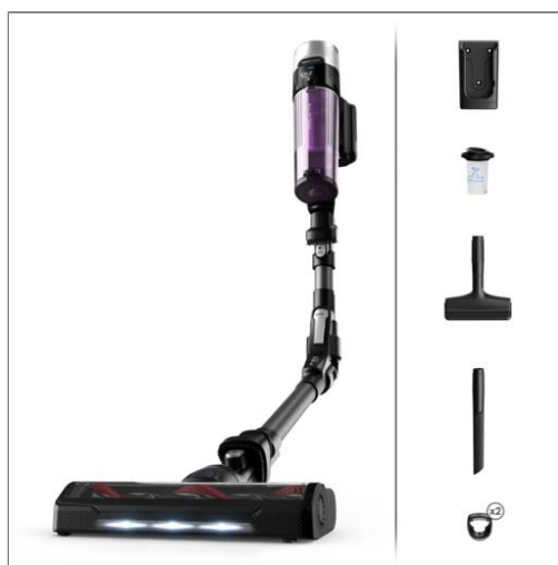
X-FORCE FLEX 9.60 KIT ALLERGIE Aspirateur balai sans fil multifonction RH2038WO