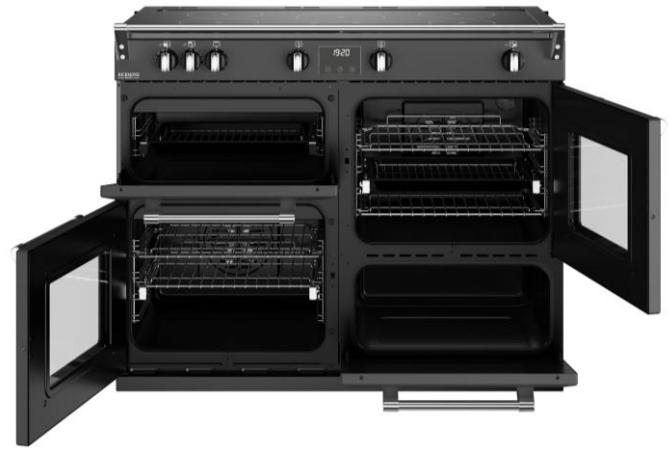
TABLE DE CUISSON 5 Foyers Induction