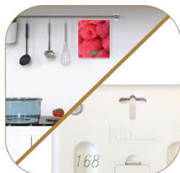
Croix de suspension intégrée au dos pour un rangement facile