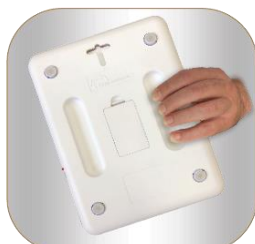
Poignées intégrées au dos pour une préhension plus facile