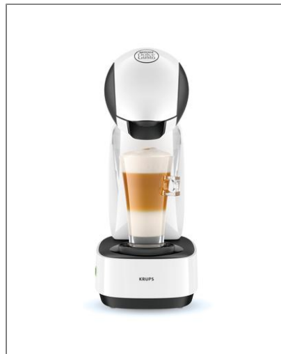
INFINISSIMA NESCAFE DOLCE GUSTO BLANCHE YY3876FD